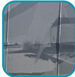
Imagen de 1970 que ilustra los efectos del temporal sobre el muelle contiguo a la antigua lonja de pescado. La escena pone en evidencia la exposición de las infraestructuras a la fuerza del mar antes de la construcción del dique de abrigo, subrayando los desafíos estructurales que condicionaban el desarrollo seguro de la actividad pesquera.

Varios pescadores recogen con urgencia las artes de pesca en la playa ante la llegada de un temporal. La imagen refleja la precariedad de aquellos años, cuando la ausencia de un dique de abrigo en Puerto de Mazarrón obligaba a actuar con rapidez para evitar pérdidas. Un testimonio del esfuerzo cotidiano frente a un mar impredecible.