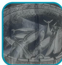
Imagen de capturas en alta mar, reforzando la importancia del trabajo bien coordinado y del respeto por la calidad del pescado desde el mismo momento de su extracción.

Embarcación pesquera navegando mar adentro, ya en faena. La imagen representa la flota actual del Puerto de Mazarrón, caracterizada por embarcaciones más seguras, equipadas tecnológicamente y adaptadas a las exigencias de la pesca profesional moderna. Refleja el dinamismo del sector y su continuidad como motor económico y cultural del municipio.