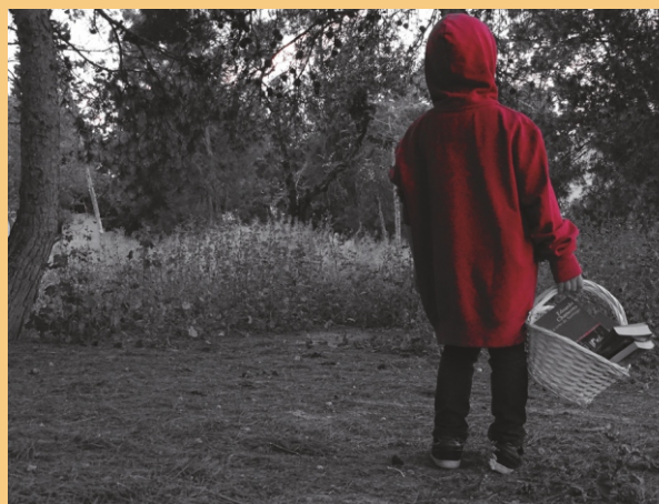
EL CONTRASTE DE LA LECTURA

Primer Premio IV Certamen de Fotografía "Nos gusta leer"